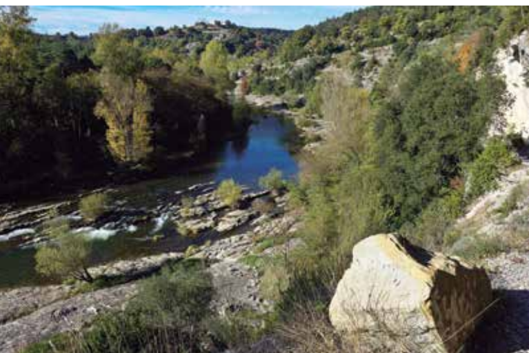
Un dels pronunciatos meandres que dibuixa el Ter passat Sant Quirze de Besora, al nord d'Osona.