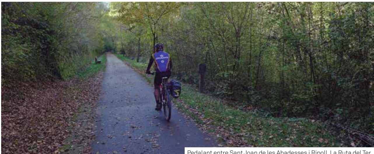
Pedalant entre Sant Joan de les Abadesses i Ripoll. La Ruta del Ter coincideix amb la via verda de la Ruta del Ferro.