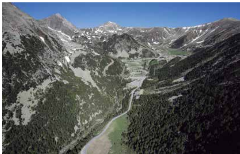
Fotografia aèria del circ d'Ulldeter, allà on neix el riu.