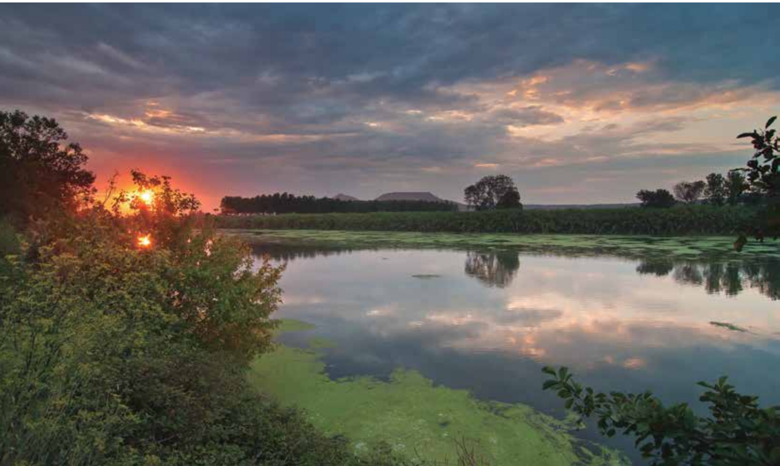
Capvespre al curs baix del riu Ter.