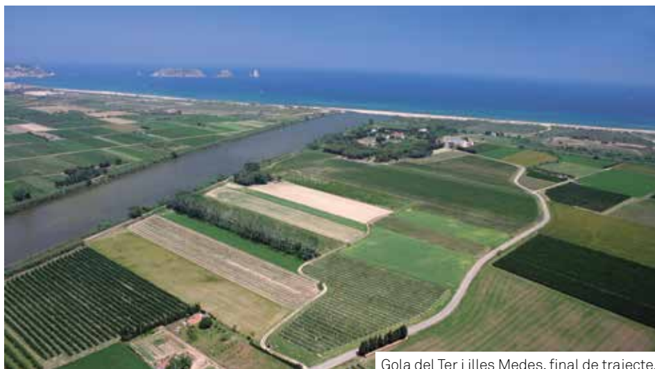
Gola del Ter i illes Medes, final de trajecte.

LES PLANES DEL BAIX EMPORDÀ TRANSFORMEN ELS MEANDRES DEL TER EN UNA RECTA QUE ES DIRIGEIX AL MAR.