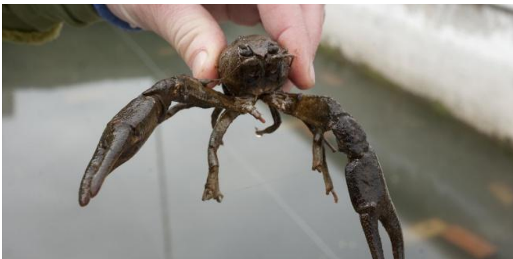
Cangrejo de río de patas blancas. Ejemplar macho de unos seis años .

El proyecto Life Potamo Fauna recupera además la náyade y la tortuga de lago