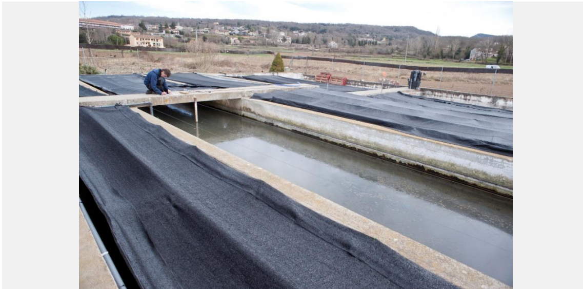
Centro de Reproducción del Cangrejo de Río Autòctono de Olot.

En el marco del proyecto Life Potamo Fauna, cofinanciado por la Unión Europea , se experimenta también con distintos métodos para combatir la plaga, como la colocación de barreras eléctricas que eviten la entrada del cangrejo americano.