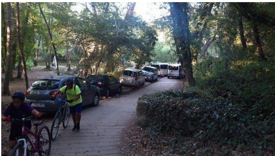
Vehicles parcats a la Pilastra entre Salt i Bescanó (Albert Requena Corcoy)

El pla ja fa temps que es cuina , sobretot després que ja s'ha vist que en alguns trams del riu i en alguns dels afluents la pressió humana sobre és del tot insostenible . Un exemple, la zona de la Pilastra entre Bescanó i Salt , on els cotxes baixen fins al costat del riu, i tallen fins i tot el carril bici de Girona a Olot.