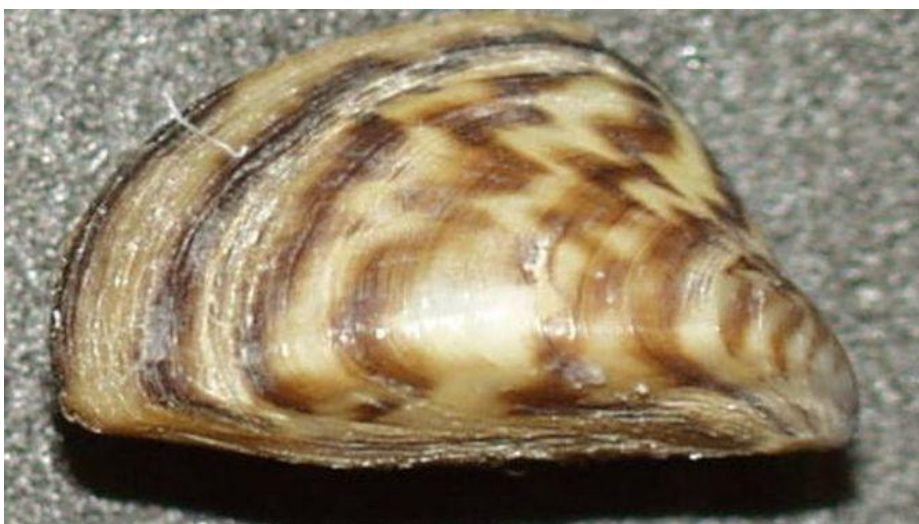
Musclo zebra

Les seves larves són molt petites i és molt difícil després controlar l'expansió d'aquesta espècie. Les despeses derivades del seu control són multimilionàries".