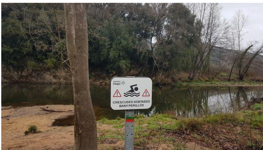
En alguns punts s'avisava del risc del bany (Consorci del Ter)

"El Glòria va destapar una altra vegada tot el que és el riu, tot el que son platges fluvials, codolars... Va deixar el riu molt més obert i la ciutadania va recuperar una mica l'interès pel riu, no? D'una banda amb percepció de risc però de l'altra, l'estiu del 2020, hi havia unes platges fluvials estupendes a molts dels nostres pobles."