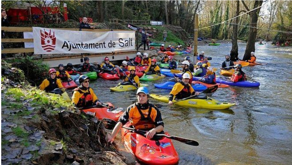
Inauguració del parc de la Pilastra (Club de Piragüisme Salt-Ter)

Per redactar aquest pla d'usos del Ter el Consorci ha consultat els 71 municipis afectats i els cinc consells comarcals . La redacció definitiva passarà una exposició pública que encara s'ha de determinar quant durarà i es preveu que estigui aprovat definitivament i sigui vigent el 2023 .